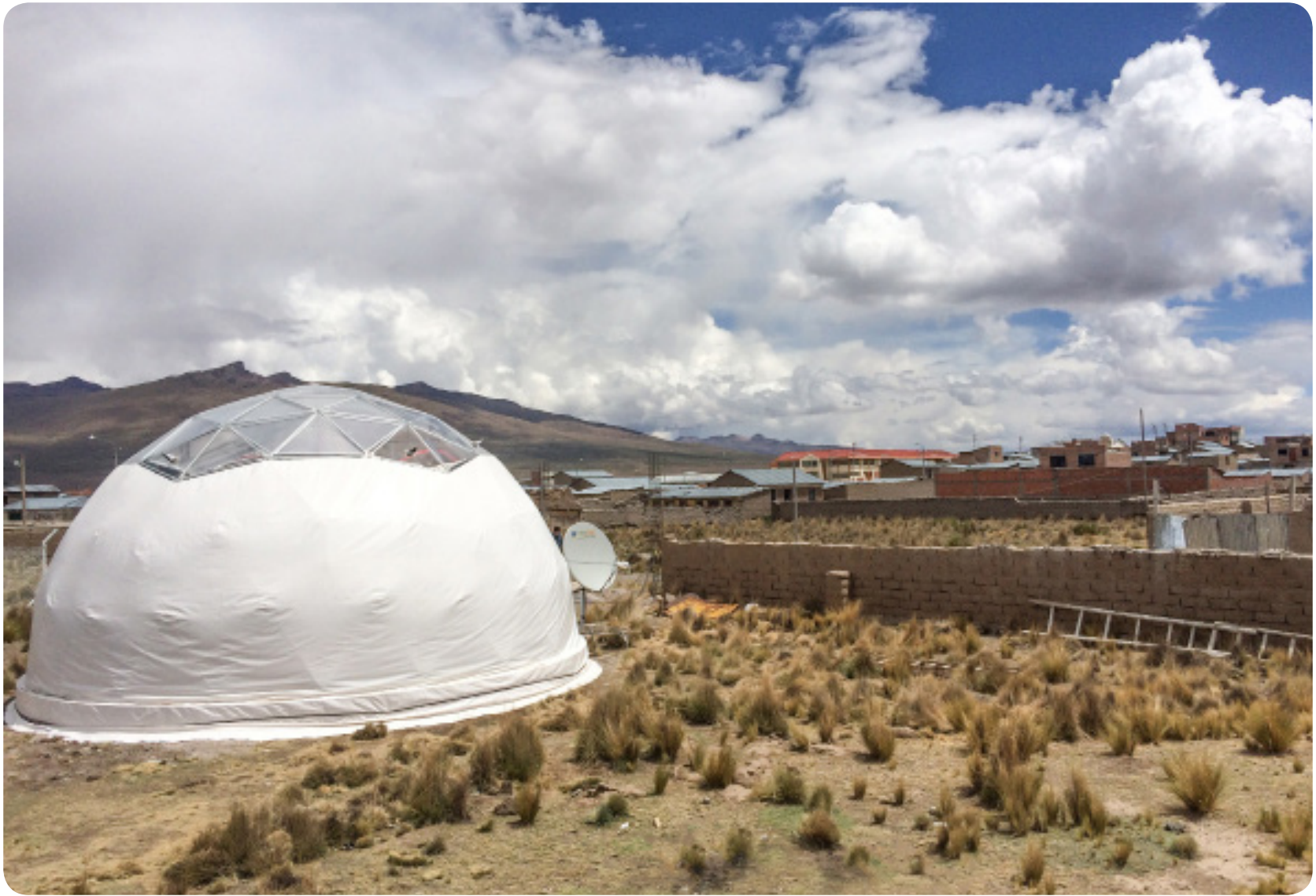
Figura 15. Domo habitable instalado en Puno con un prototipo del sistema de control de temperatura en su interior.